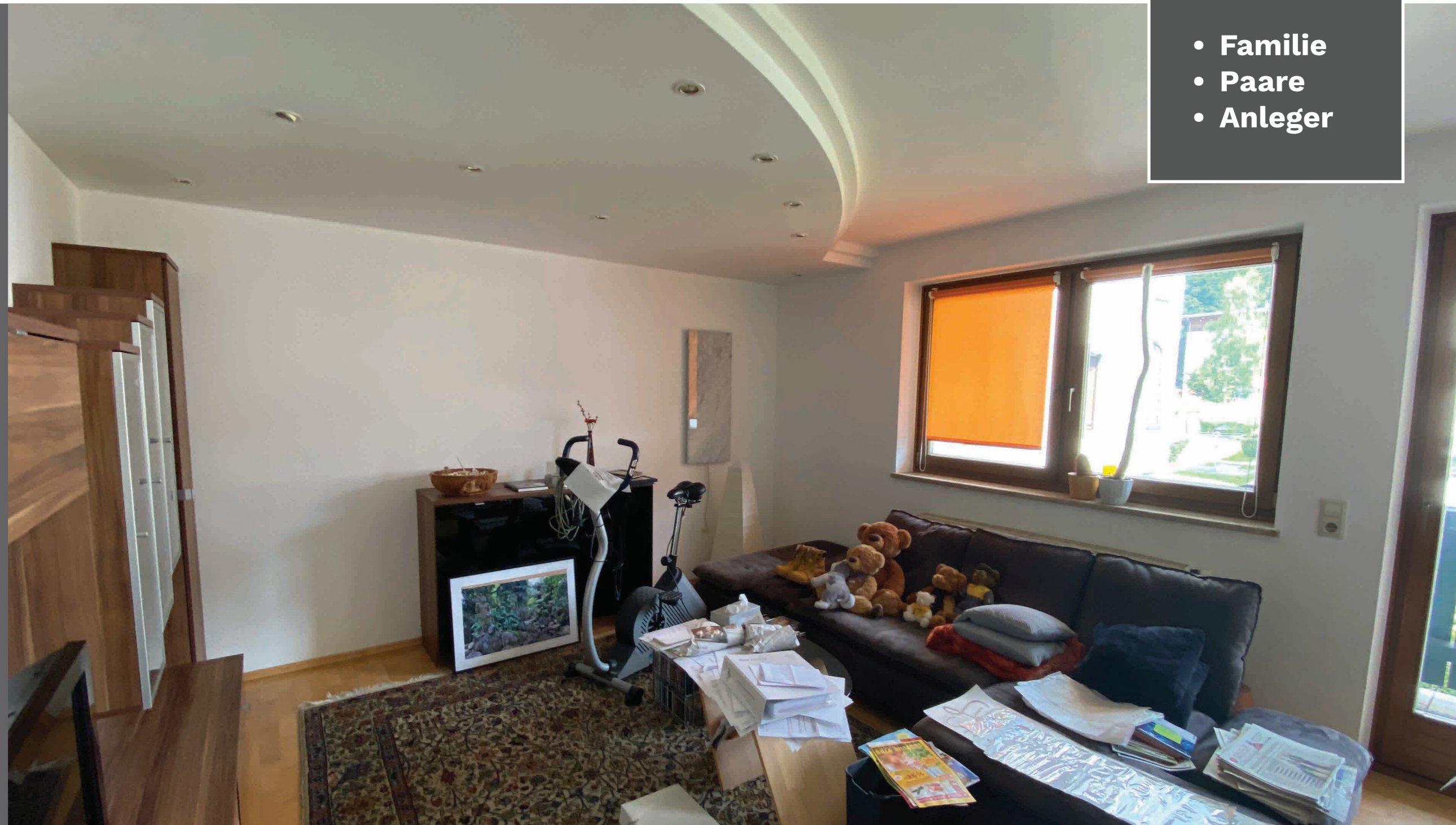
TOP AUFGETEILTE 3 ZIMMER WOHNUNG